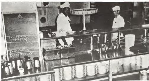
Esaki ta den cushina, unda e delicioso platonan ta ser prepará. Nota e limpieza y higiena — tur e equiponan ta di stainless steel.